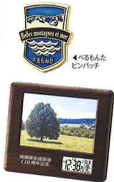
▲フォトフレーム時計(120周年記念限定のオリジナルプリントが入ります)

B賞 6個のスタンプを集めて応募 12名様 沿線4市特産品 ※ご希望の景品をお選びください。