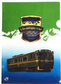
▲べるもんだ クリアファイル

A賞 10個のスタンプを集めて応募 5名様 城端線全線開通120周年限定 オリジナルフォトフレーム 電波時計&べるもんだグッズ