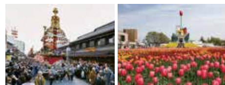
ユネスコ無形文化遺産・高岡御車山祭 ／高岡市 北陸の春を呼ぶとなみチューリップフェア ／砺波市