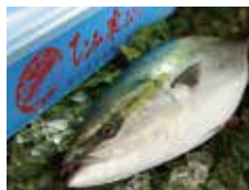
「富山湾の王者」ひみ寒ぶり ／氷見市