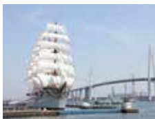
「海の貴婦人」と呼ばれる帆船海王丸 ／射水市