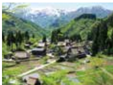
世界遺産五箇山合掌造り集落(相倉集落) ／南砺市