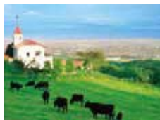
優良和牛を育成する稲葉山牧野 ／小矢部市