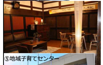
⑤地域子育てセンター