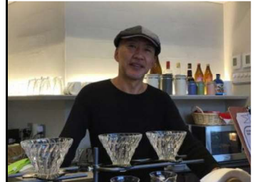
⑦Café Home Grown