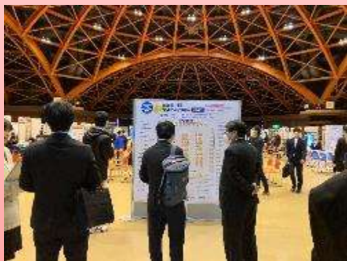
昨年の開催風景(高岡テクノドーム)