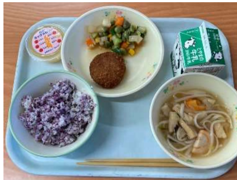
「ごーせいなメンチカツ」に各市のブランド肉を使用し、より豪勢になるようブラッシュアップを図っています。